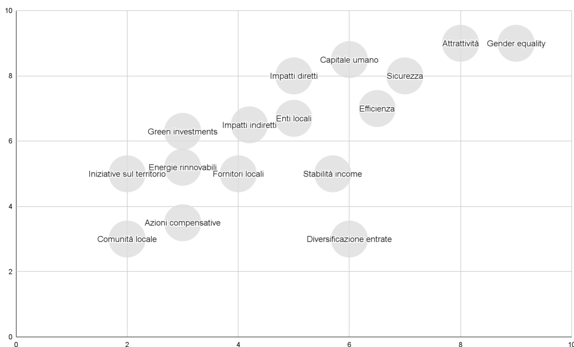
Matrice di materialità

Si tratta di un grafico bidimensionale che illustra: